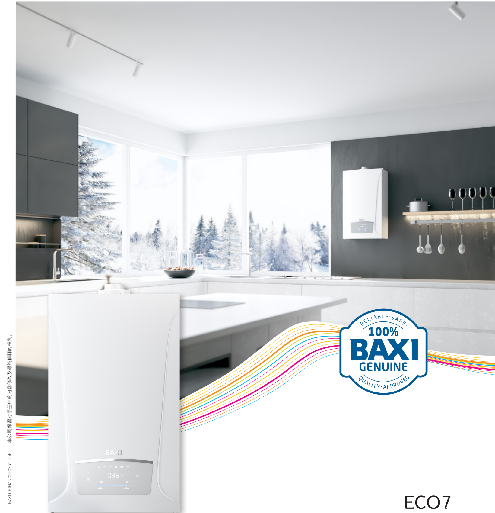
BAXI CHINA 202203 YC1040 本公司保留对手册中的内容修改及最终解释权权利。